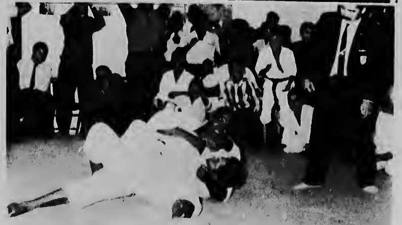
Aki nos por mira con Levestone ta tene Toco Tromp te cu nan ta dicidi e pelea na favor di Levestone, pa limite di tempu.

Nos kier a felicita e equipo Arubano senior pa e victoria obtene den e campeonato antillano, y tambe e equipo junior di Corsow cu a logra e titulo maximo. Nos pabien tambe pa tur e participantenan.